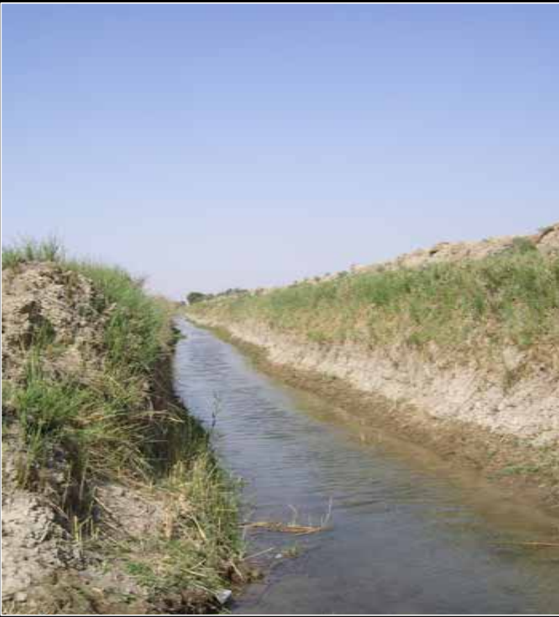
Irrigation Water Flowing Continuously Near Taji