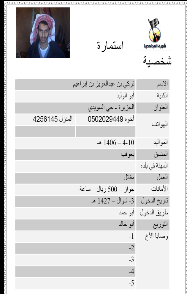
Foreign Terrorist Biography